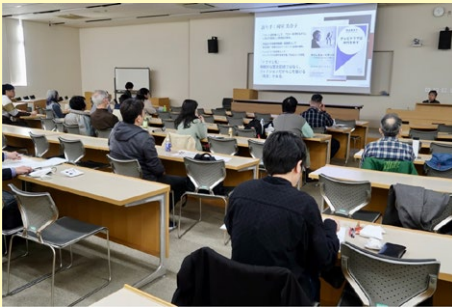
岡室会員 講演の様子

ホームドラマの温かい家族像とは、残存する封建的父権性を隠蔽し、下町という「過去のコミュニティ」を舞台にすることで辛うじて成立させた虚構にすぎない。70年代ホームドラマは、「テレビの実験精神」の観点からは一見、零れ落ちてしまいかねないが、実はこの時代のホームドラマにこそ戦後の日本社会を読み解くための鍵が込められているという示唆で締めくくられた。