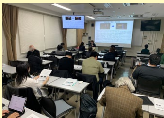
(おおはしまさる／関西支部、大阪芸術大学)