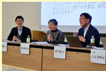
会場からも多くの質疑が寄せられ笑顔で応える登壇の先生方

ホームドラマで豊富な議論ができ、テレビドラマ史が描けるのではないかと感じた。楽しく有意義な時間だった。